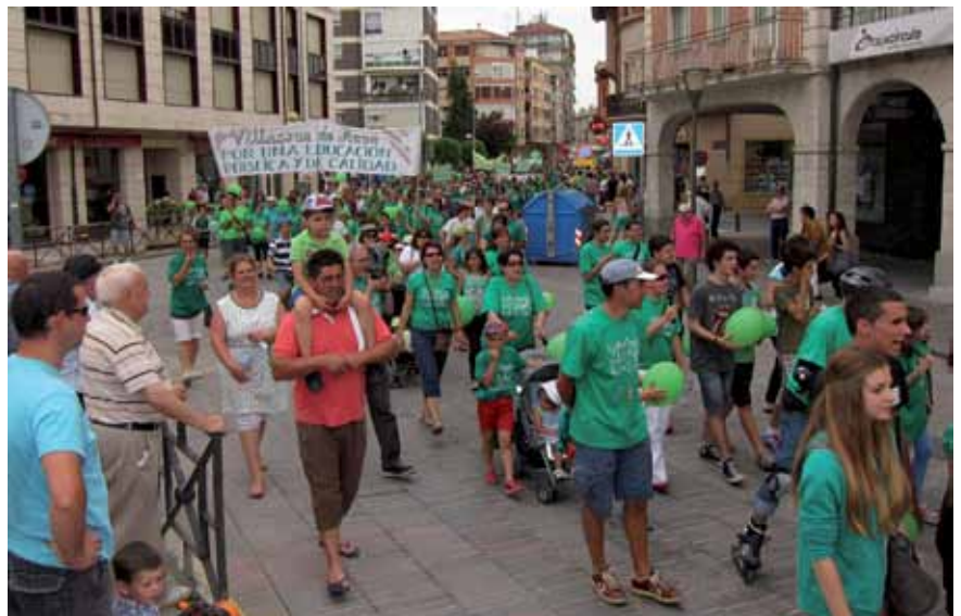
La manifestación partió del IES de Medina de Pomar y finalizó en la Plaza de Somovilla de la misma localidad, donde se leyó un manifiesto en defensa de la enseñanza pública