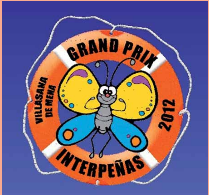
El Grand Prix Interpeñas ha sido la gran novedad de las fiestas de este año y ha sido un rotundo éxito de participación

Esta comisión está formada el Ayuntamiento y por 25 miembros de más