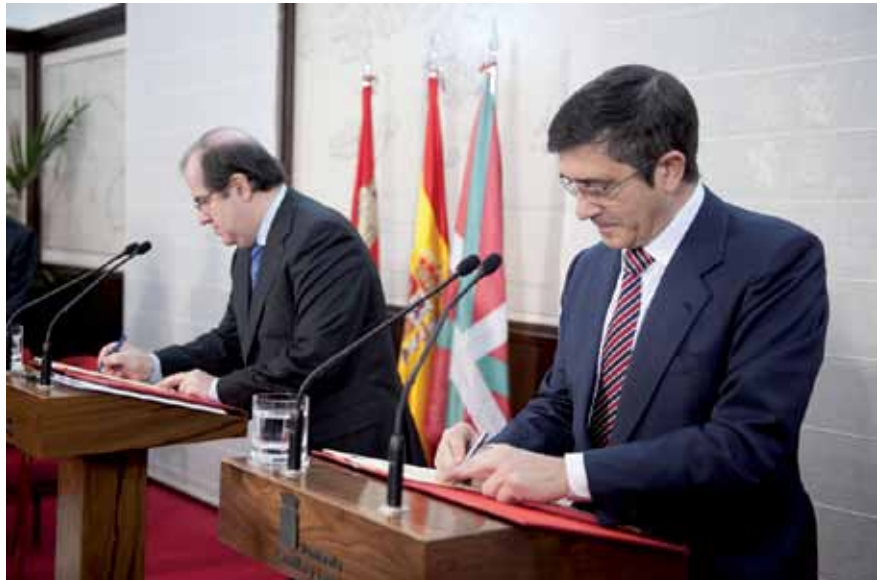
Momento de la firma del convenio entre Juan Vicente Herrera y Patxi López

La Junta de Castilla y León y el Gobierno Vasco se comprometen a mantener la colaboración que ya se viene desarrollando en materia sanitaria y a estudiar posibles ampliaciones. En el texto acordado se especifica que la atención a las urgencias y emergencias de las zonas limítrofes se realizará por el dispositivo más óptimo en cada caso y se mantendrá la colaboración en atención primaria, atención especializada, atención sociosanitaria y nuevas tecnologías. El