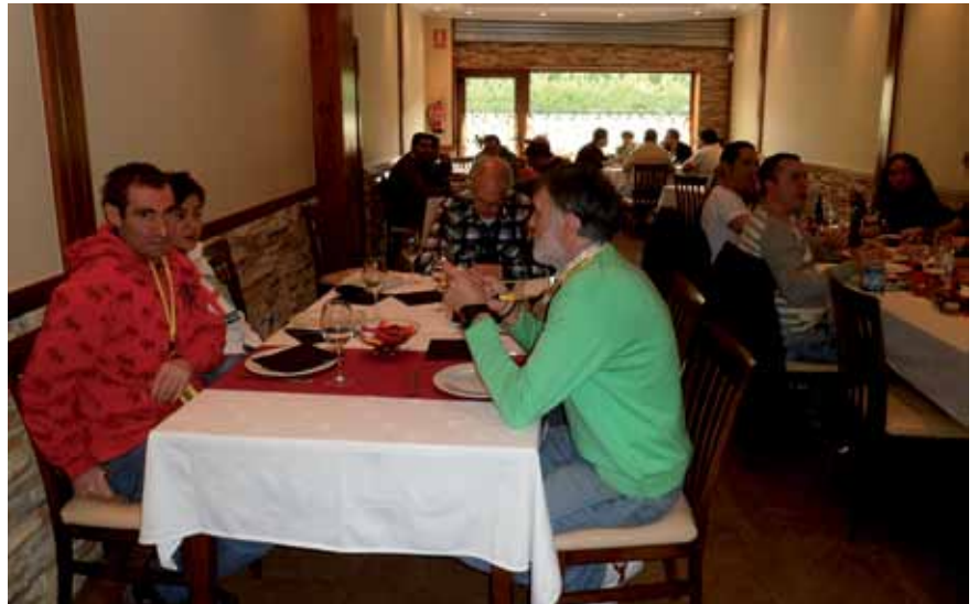
La quedada automovilística ha generado ingresos extras para los restaurantes meneses. En la foto alguno de los participantes en el Restaurante Gran Encinar de Villasana de Mena.