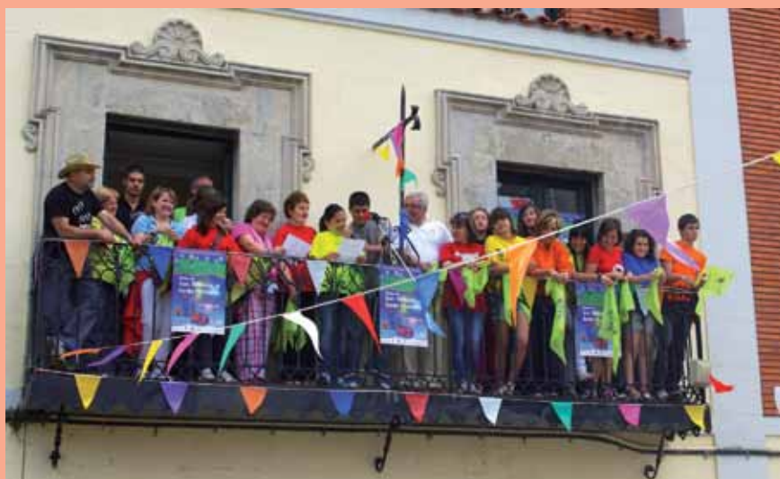
El pregón de las fiestas de este año corrió a cargo de las peñas que contagiaron su alegría a todos los vecinos

La celebración de este Grand Prix también ha supuesto una prueba para la Comisión de Fiestas y, esta prueba se ha superado con creces: el número de peñas constituidas formalmente este año se ha incrementado en algo más de un 40% respecto al año pasado. Este era uno de los principales objetivos y el gran reto para el equipo organizador que, a lo largo de cuatro meses, ha es-