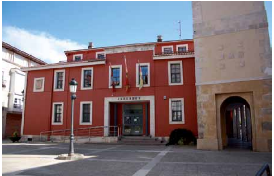
Los juzgados de Villarcayo registraron 4.800 asuntos civiles y penales durante el pasado año 2011

La respuesta del Ministerio de Justicia a las aclaraciones solicitadas por el ayuntamiento menés ha llegado en forma de carta en la que se indicaba que el