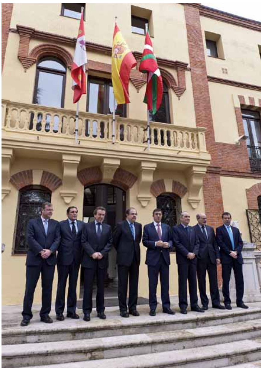
En la firma de este convenio, realizada en Valladolid, estuvieron también presentes miembros de ambos gobiernos

La colaboración en la lucha contra la violencia de género también forma parte de este protocolo de actuación conjunta. Los dos gobiernos han acordado la disposición de distintas modalidades de centros de acogida, desarrollo de distintas campañas de concienciación en contra de esta lacra, intercambio de experiencias entre los profesionales de ambas comunidades y actuaciones