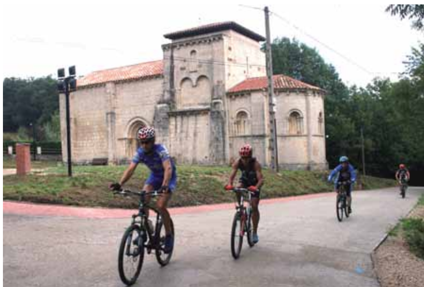
El recorrido de la Ruta del Románico Menés supone un recorrido por las vías que unen los mejores monumentos del Románico en el valle de mena

Según los datos que maneja el Ayuntamiento menés, el turismo de bicicleta es una forma de turismo en expansión en toda Europa. Además, este tipo de