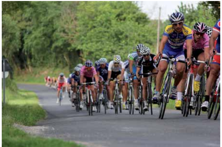
El pelotón bajando, llegando a la curva de la Virgen de Vallejo

Un año más, esta prueba ciclista contó con el apoyo del público que siguió la carrera en varios tramos. Los aficionados meneses no faltan a su cita con