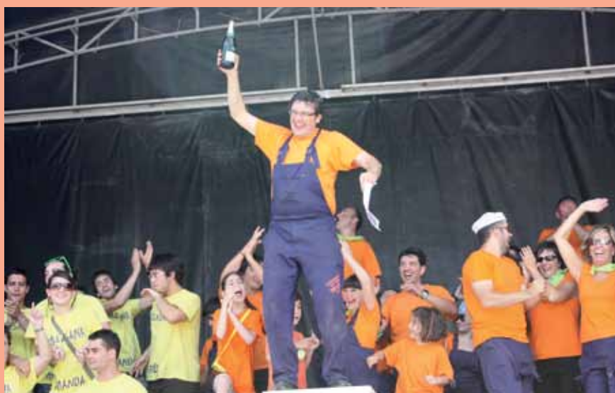
Al final, la Peña “30 y Pico” se alzó con el I Trofeo Grand Prix Interpeñas