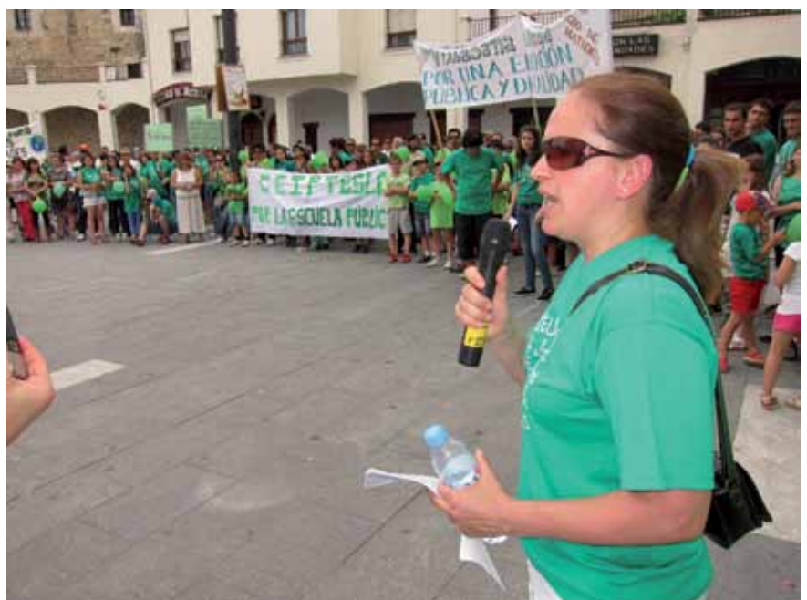
En el manifiesto quedaron patentes los puntos de lucha de esta Plataforma en defensa de la educación pública