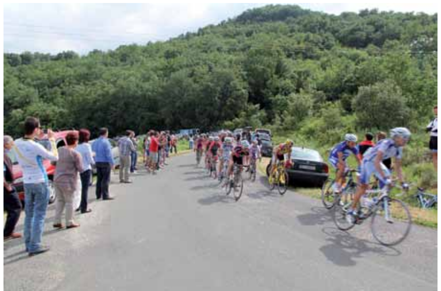
Los ciclistas coronando el alto del Carel, el punto que más seguidores concentra junto a los pasos por Villasana

este premio que vuelve a situar al Valle de Mena como una de las pruebas más importantes del calendario para las categorías Élite y Sub-23.