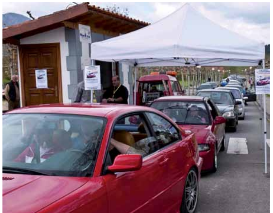
La caravana de coches saliendo del polideportivo municipal de Villasana, donde se realizó la primera concentración, para dirigirse a Sopeno