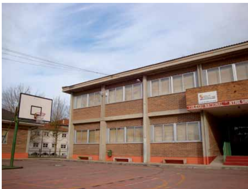
En el CEIP “Nuestra Señora de las Altices” están matriculados 215 alumnos y trabajan veintitrés maestros

hacen más fácil la convivencia y el crecimiento personal. Es una tarea indispensable y, en nuestro entorno rural, este servicio público, hecho con muchas limitaciones y dificultades, es el único de que disponemos para un adecuado desarrollo personal y social”.