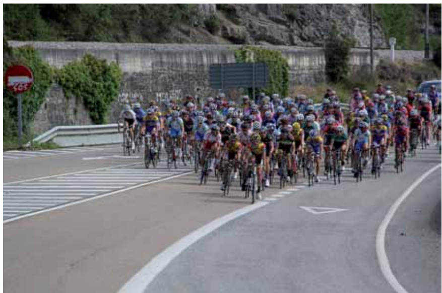
El pelotón en llegada a Ungo en la primera vuelta de la prueba