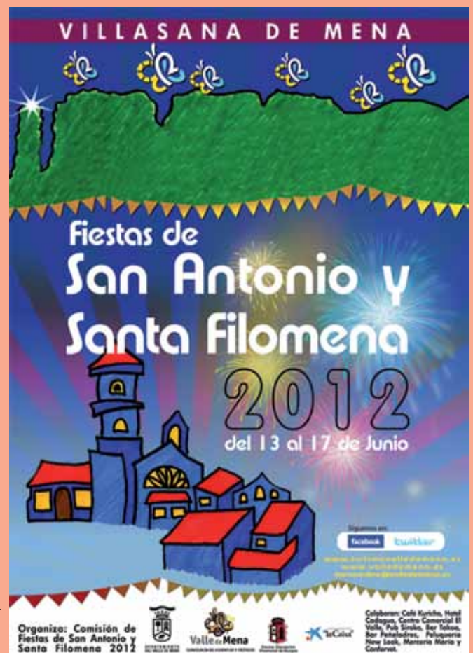
Cartel de fiestas realizado por Aitziber Ureta Valle