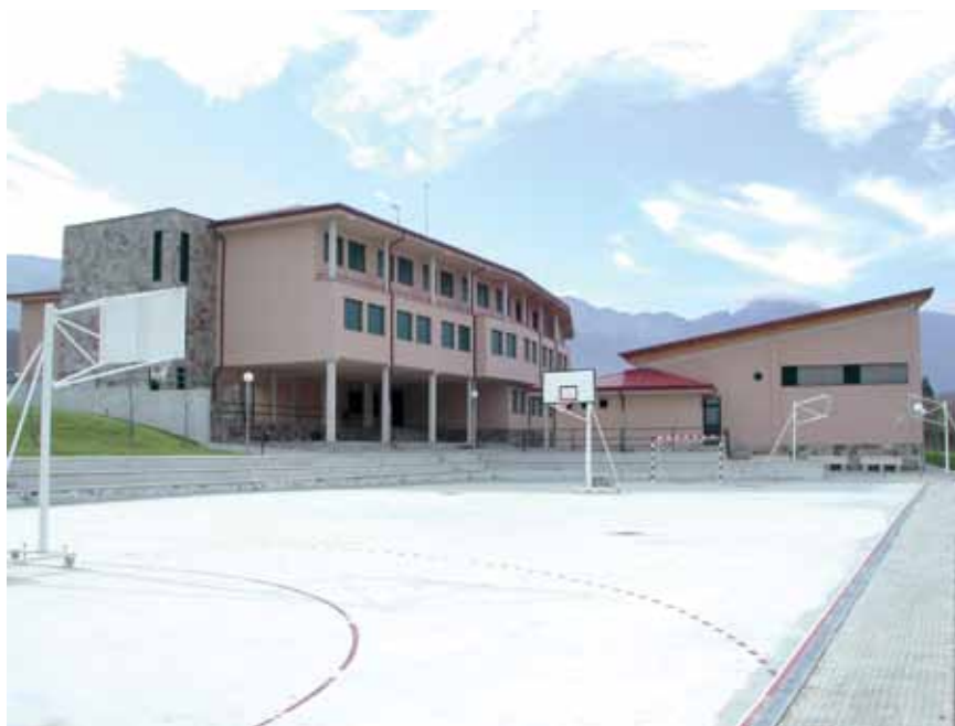
En el IES “Sancho de Matienzo” de Villasana de Mena estudian 134 alumnos y trabajan 26 profesores

Los padres y madres que se manifestaron el pasado día 2 de junio también quisieron reconocer “el papel que los centros educativos y el profesorado realizan en nuestra comarca. Ellos no solo educan y convierten su profesión en un servicio a los niños y jóvenes y a las familias sino que además benefician al conjunto de la sociedad apostando por la formación y la cultura, por preservar y cuidar de nuestra historia y de sus raíces, garantizan la formación humana y en valores sociales y democráticos que