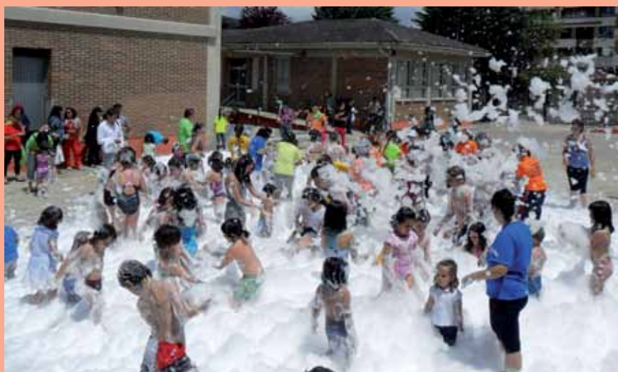
La fiesta de la espuma fue una de las actividades más divertidos para los niños

El Concejal de Festejos y Juventud también quiere trasladar su felicitación a “todas las empresas y locales colaboradores que han querido sumar su esfuerzo a las Fiestas de Villasana: Café Kuriche, Hotel Cadagua, Centro Comercial el Valle, Pub Siroko, Bar Takoa, Bar Peñaladros, Peluquería New Look, Mercería María y Confovert” que se han unido a las peñas y vecinos para que las Fiestas de San Antonio y Santa Filomena volvieran a ser un éxito de participación.